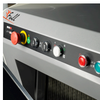
Tableau de commandes

Réglage motorisé de la hauteur du tapis supérieur (hauteur des pains). A côté des commandes frontales, un compteur d'heures vous permet d'enregistrer votre temps de travail avec précision.