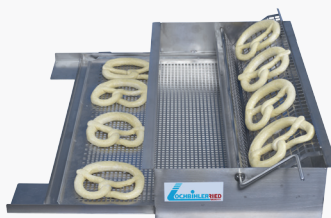
Schwabenschwenker LSS 60