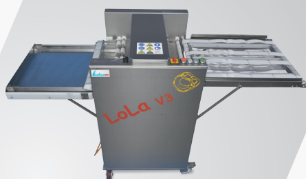
Belaugungsmaschine LoLa V3