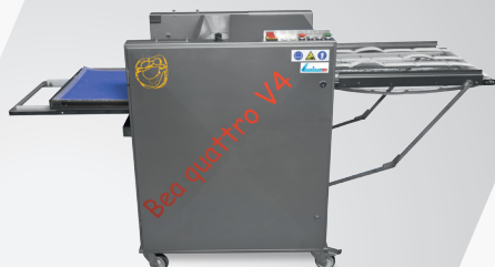
Belaugungsmaschine Bea quattro V4