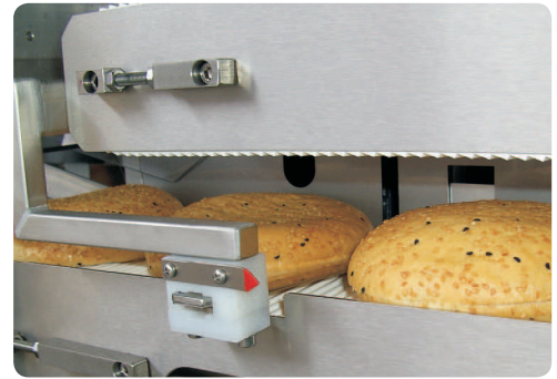
... schneidet kleine Fladen