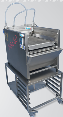
Filialbelaugung FiBa 60