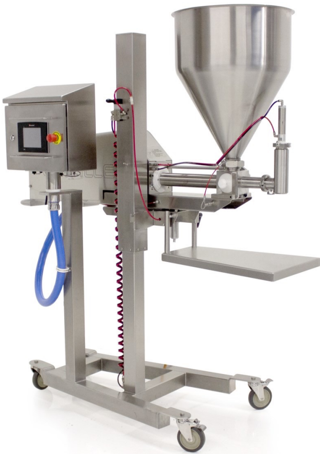
Beispiel-Foto; Maschine mit Zubehör ausgestattet

Die Universal 2000i Servo FS ist eine einzigartige Kolbendosieranlage mit Servo-Steuerung für die lebensmittelverarbeitende Industrie. Diese Hochleistung-Dosieranlage erfüllt höchste Hygiene-Anforderungen und wurde speziell für das schnelle und saubere Dosieren großer Mengen und von Massen mit großen Stücken entwickelt. Sie ist hervorragend geeignet für die Verarbeitung von zäh fließenden bis flüssigen Produkten mit oder ohne Stücken wie z.B. Teige, stückige Füllungen, Saucen, Salaten, Pie-Füllungen, Suppen und vielem mehr.